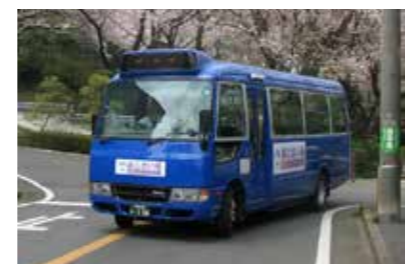
サクラ並木を走る青いあじさい号

昨年12月5日、長尾台コミュニティバス「あじさい号」運行1周年を記念した報告会とイベントが長尾会館で開催され、住民、川崎市役所、バス会社など関係者80名が参加しました。利用者協議会による1年間の運行状況の報告や運行継続のための支援のお願いがあったほか、新百合ヶ丘総合病院の医師による健康セミナー、地震で被災したネパールの話、日本舞踊、そして懇親会と盛りだくさんの内容でした。