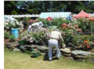
ボランティアがバラを維持管理

開苑中は、ボランティアガイドも行っていますので、是非綺麗な「バラ」を観に来てください。