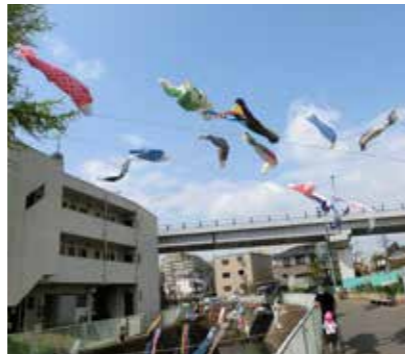
青空にたなびく鯉のぼり

小田急線生田駅から、五反田川に沿って200m東に展開します。子どもたちと一緒に、春のひと時を楽しく過ごしませんか？