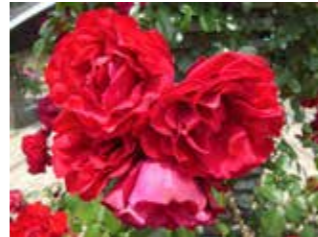
5月に綺麗なバラが見られます