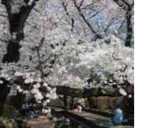
用水沿いの美しいサクラ

この二ヶ領用水沿いは、地域の人たちが除草、落ち葉や川のゴミ清掃を常日頃前から行って、サクラも素晴らしいが沿線の景観も綺麗で素晴らしいという声も聞かれます。