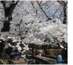
用水沿いの美しいサクラ

この二ヶ領用水沿いは、地域の人たちが除草、落ち葉や川のゴミ清掃を常日頃前から行っていて、サクラも素晴らしいが沿線の景観も綺麗で素晴らしいという声も聞かれます。